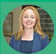
Cyng Llinos Medi Aelod Arweiniol