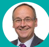
Cyng Dyfrig Siencyn Aelod Arweiniol